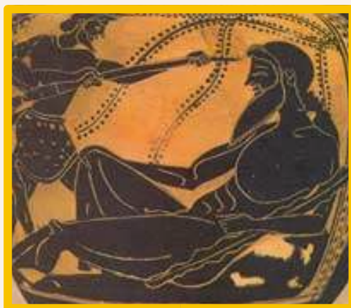
Εικόνα 2. Η τύφλωση του Πολύφημου,

Εκείνο βέβαια που έχει τη βαρύνουσα σημασία στη σημερινή εργασία, δεν είναι η όποια ερμηνεία της ιστορίας. Είναι η γνώση της γύρω από το ζήτημα των κυκλώπειων τυριών. Το πόσο μεγάλο είναι το βάθος στο οποίο βρίσκονται τα αγροτικά διατροφικά όσο και τα γαστρονομικά θεμέλια του Θρακικού χώρου. Από την οινοποιητική μονάδα του Μάρωνα ως τη γαλακτοβιομηχανία καθώς επίσης και κρεατοβιομηχανία του Πολύφημου. Κυρίως όμως ότι τα προϊόντα όλων τους έχουν ένα μοναδικό όσο αναξιοποίητο και μεγάλο προσόν. Είναι τα πρώτα, λόγω Ομήρου, στη γραπτή ιστορία της Οικουμένης, με ιστορική ονομασία προέλευσης. Επί το ορθότερο, προϊστορική.