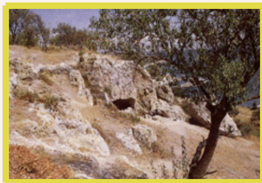
Εικόνα 2. Η σπηλιά και η ελιά,

Σπηλιές Κύκλωπα υπάρχουν πάρα πολλές. Από τη Λευκάδα, τον Αστακό και τη Λακωνία έως τον Αι Στράτη, τα Γιούρα, τη Σέριφο και την Κρήτη και έως την Κάτω Ιταλία. Πρόκειται άλλωστε για ένα συχνό φαινόμενο με τους μύθους. Από την άλλη όμως, τρεις τουλάχιστον λόγοι δίνουν σημαντικό προβάδισμα στην Μάκρη του Έβρου. Ο πρώτος έχει να κάνει με τη σειρά και τη συμπερίληψη των δυο όμορων τόπων -του ενός με το Μαρωνεΐτη οίνο, του άλλου με τη σπηλιά του Κύκλωπα- στην ίδια ραψωδία. Ο δεύτερος είναι αυτή καθεαυτή η αφήγηση του Οδυσσέα που συνδέει τα δυο μέρη μεταξύ τους. Επίσης ως προς τους όχι και τόσο ευγενείς σκοπούς που είχε κατά τις επισκέψεις του. Ακόμη και ο ίδιος ο ποιητής χρησιμοποιεί τη λέξη «ελθόντες» {βλ. στ. 218} όταν αμέσως αποδεικνύεται ότι μπήκαν στη σπηλιά λάθρα. Ο τρίτος λόγος ενισχύει ακόμη πιο πολύ την επιχειρηματολογία, λόγω της χρήσης του Μαρωνεΐτη οίνου, ως όπλου.