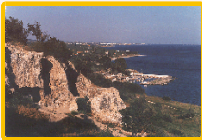
Εικόνα 1. Σπηλιά Κύκλωπα, λιμάνι Μάκρης, Αλεξανδρούπολη.

Όμως είναι βέβαιο, όπως άλλωστε συνεχίζει μέχρι στο τέλος της ίδιας ραψωδίας να αφηγείται ο πολυμήχανος βασιλιάς της Ιθάκης, « η σπηλιά του Κύκλωπα» δεν είναι άλλο από μια πλήρως καθετοποιημένη γαλακτοβιομηχανία {παραγωγής τυρών κλπ} όσο βιομηχανία κρεάτων μικρών ζώων, κυρίως αιγοπροβάτων. Από την άλλη πλευρά η λεπτομερειακή περιγραφή των επιμέρους χώρων και εργαλείων τυροκομίας χρειάζεται να προστεθεί στις υπόλοιπες αρετές του ποιήματος και του δημιουργού του, ων ουκ έστιν αριθμός.